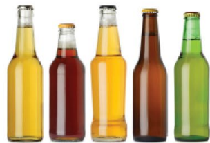
Bouteilles en verre